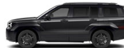
Abyss Black Pearl