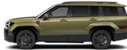
Ocado Green Pearl