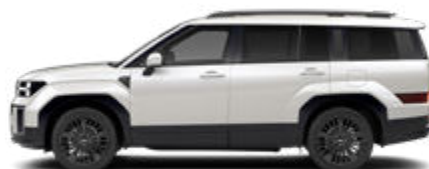
Creamy White Pearl