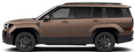
Earthy Brass Matte