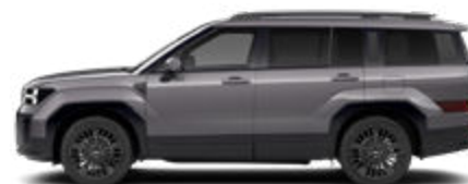
Magnetic Gray Metallic