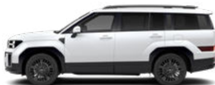
Creamy White Matte