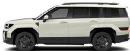
Cyber Sage Pearl