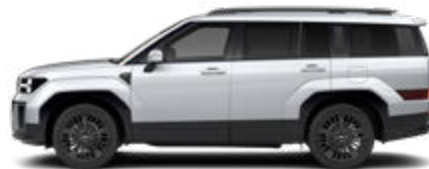
Typhoon Silver Metallic