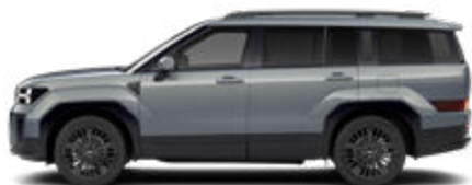
Pebble Blue Pearl