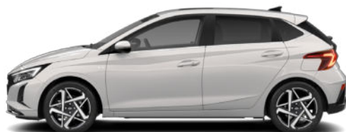
Lumen Gray Pearl Kontrastdach verfügbar