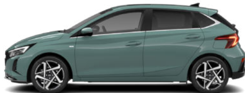
Mangrove Green Pearl Kontrastdach verfügbar