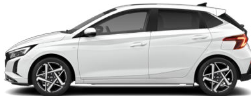
Atlas White Kontrastdach verfügbar