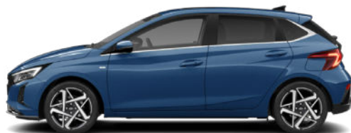
Vibrant Blue Pearl Kontrastdach verfügbar