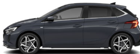
Aurora Gray Pearl