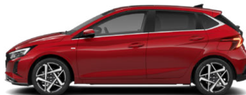
Dragon Red Pearl Kontrastdach verfügbar