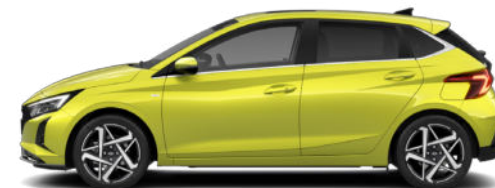
Lucid Lime Metallic Kontrastdach verfügbar