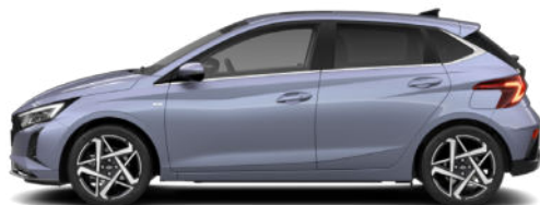
Meta Blue Pearl Kontrastdach verfügbar